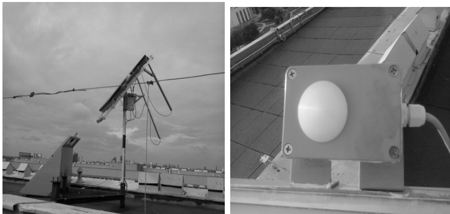
Rys. 1. Widok przygotowanego stanowiska badawczego wyposażonego w krzemowy czujnik gęstości mocy promieniowania słonecznego

Irradiancja na płaszczyźnie poziomej została zmierzona za pomocą krzemowego czujnika mikroprocesorowego LB – 900, stanowiącego element stanowiska badawczego przedstawionego na rysunku 1. Na podstawie uzyskanych wartości, dla przyjętego kroku pomiarowego, obliczono wartość dobowego nasłonecznienia, rozumianego jako suma natężenia promieniowania słonecznego na jednostkowej powierzchni i w przyjętym okresie czasu. Wartość tej wielkości porównano następnie z wartością obliczoną na podstawie modelu Hargreavesa – Samani.